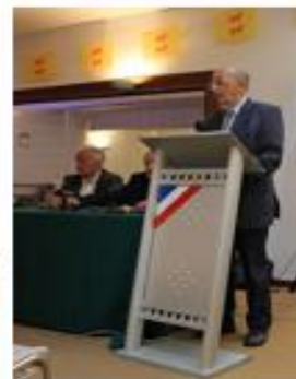
Bernard POTTIER Pt d'honneur Institut de France Co-Dir revue Modèles linguistiques Académie des Inscriptions et Belles-Lettres