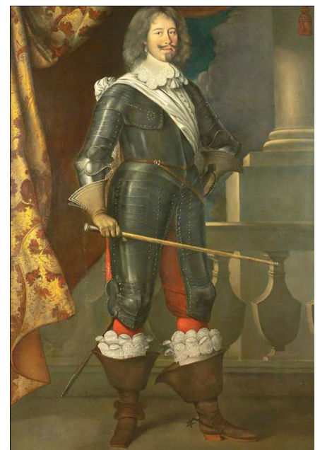
Le Comte de Treville

(cf. J.F. Demange, Les Cadets de Gascogne)