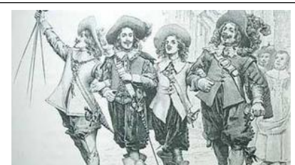
Les 4 Mousquetaires